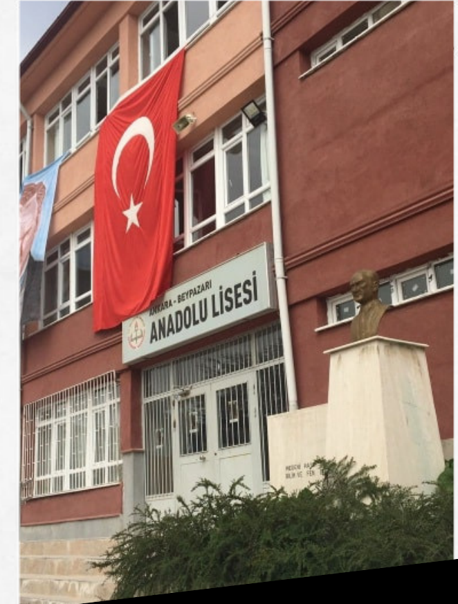
Beypazarı Anadolu Lisesi

Yerel Yerleştirme ile öğrenci almaktadır.