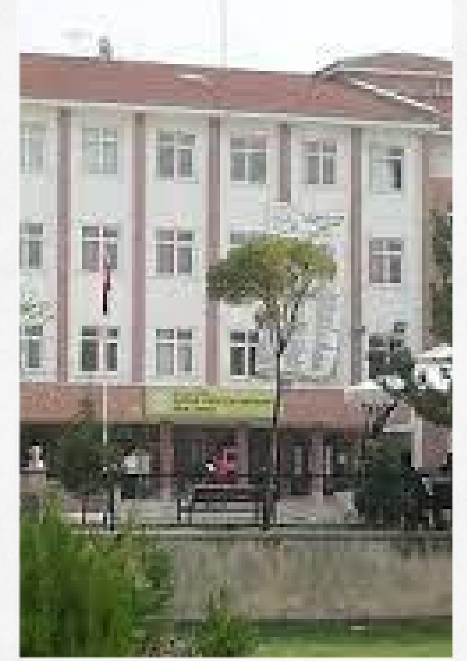
GüdüL Hasan Hüseyin Akdede Fen Lisesi

2021 taban puan: 353.0039 2021 yüzdellik dilim: %13.57 2021 kontenjan: 180