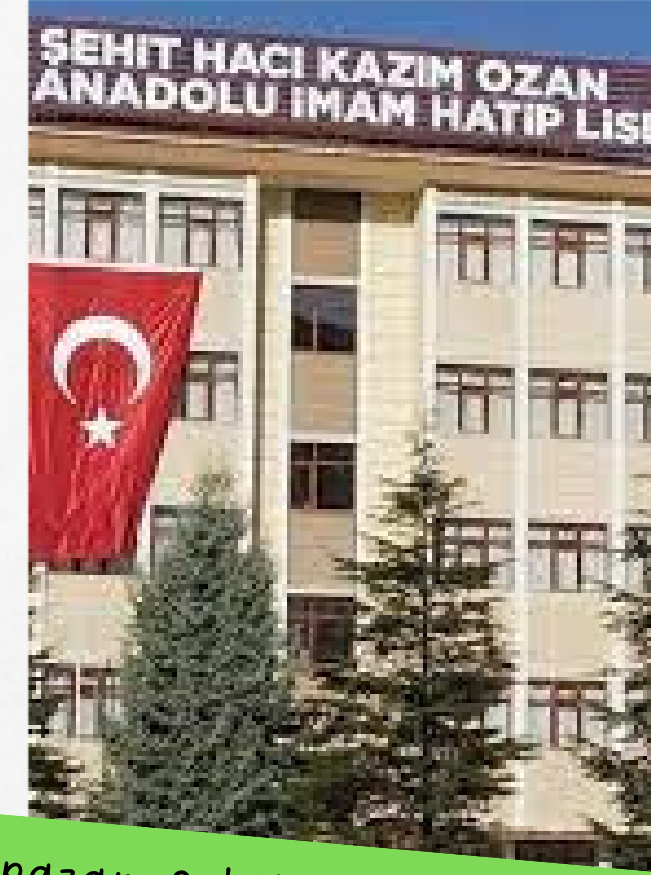
Beypazarı Şehit Hacı Kazım Ozan Kız Anadolu İmam Hatip Lisesi

Yerel Yerleştirme ile öğrenci almaktadır.