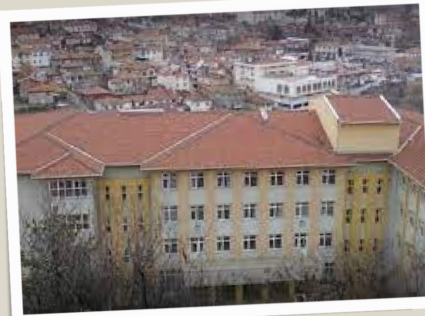
Ayaş Şehit Rıdvan Süer Anadolu Lisesi

Yerel Yerleştirme ile öğrenci almaktadır.