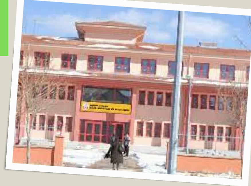
Ankara Güzel Sanatlar Lisesi Müzik Bölümü, Resim Bölümü vardır.

Müzik Bölümü, Resim Bölümü ve Türk Halk Müziği Bölümleri vardır.