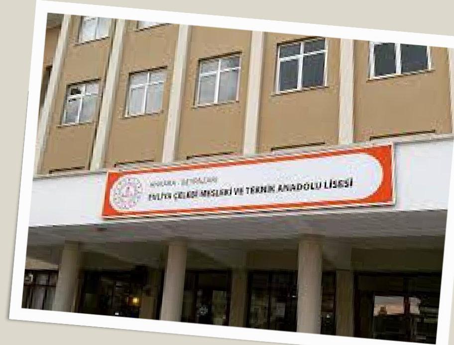
Beypazarı Evliya Çelebi Mesleki ve Teknik Anadolu Lisesi