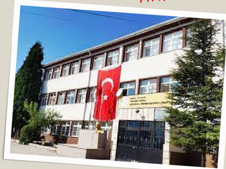
Beypazarı Tolunay Özaka Mesleki ve Teknik Anadolu Lisesi_