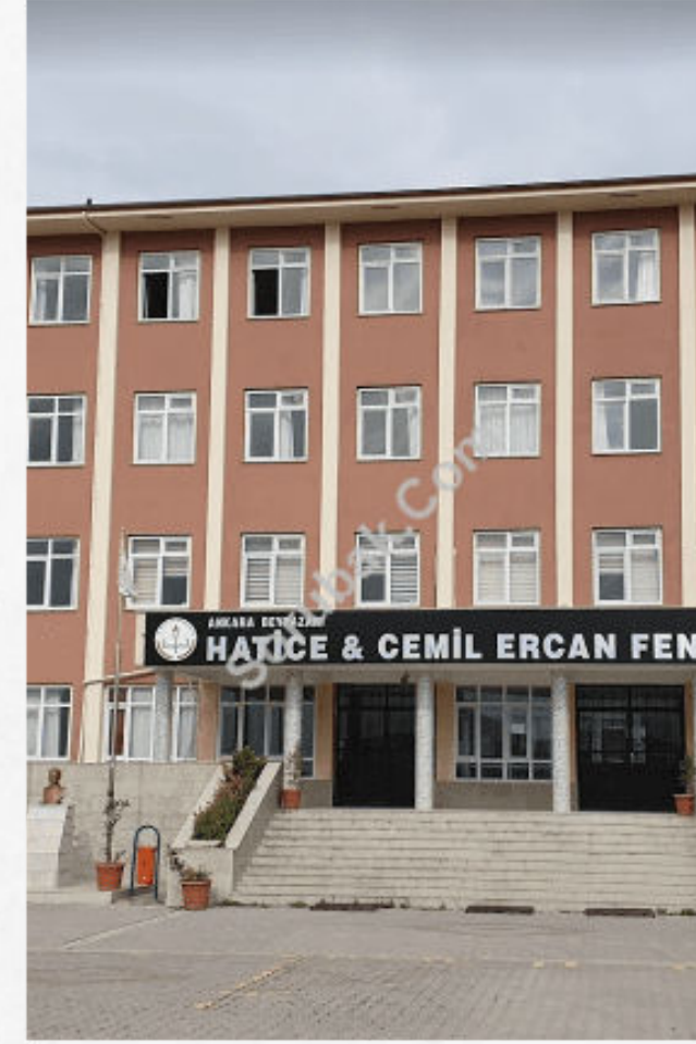
Beypazarı Hatice Cemil Ercan Fen Lisesi

2021 taban puan: 353.0039 2021 yüzdellik dilim: %13.57 2021 kontenjan: 180