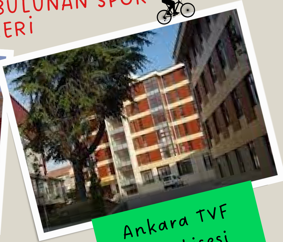
Ankara TVF Spor Lisesi