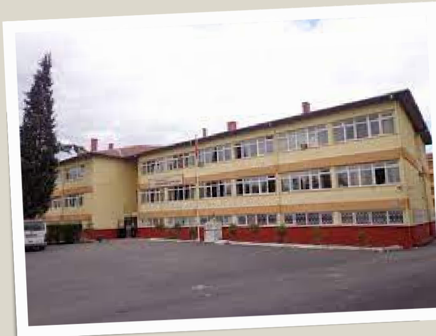
Beypazarı Şehit Sefa Tiftik Erkek Anadolu İmam Hatip Lisesi

Yerel Yerleştirme ile öğrenci almaktadır.