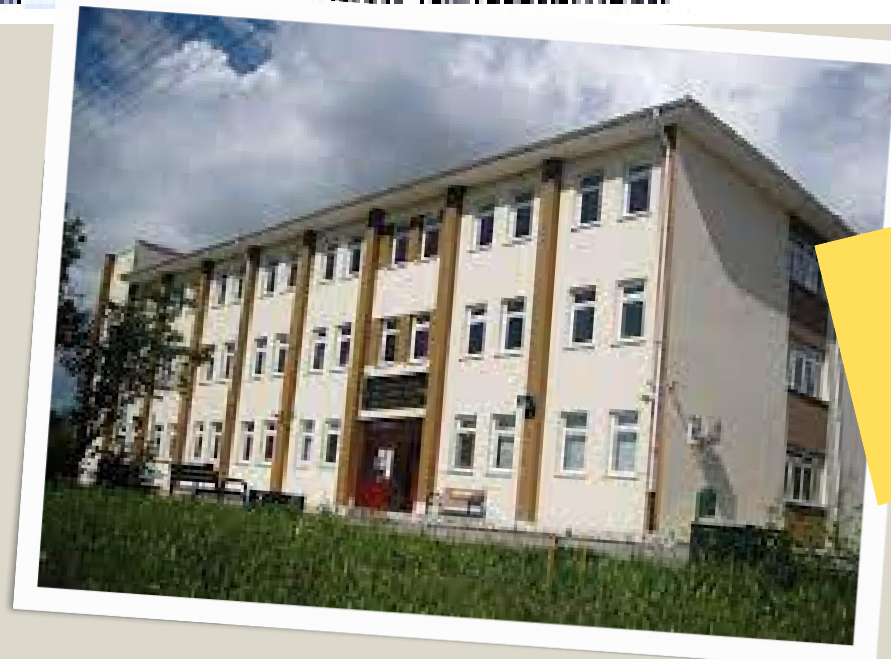
GÜDÜL SAFİYE AKDEDE ÇOK PROGRAMLI ANADOLU LİSESİ

Bu bölümde yer alan okullar Yerel Yerleştirmeye öğrenci almaktadır.