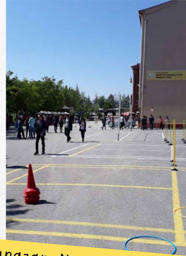
Beypazarı Nurettin Karaoğuz Vakfı Anadolu Lisesi

Yerel Yerleştirme ile öğrenci almaktadır.