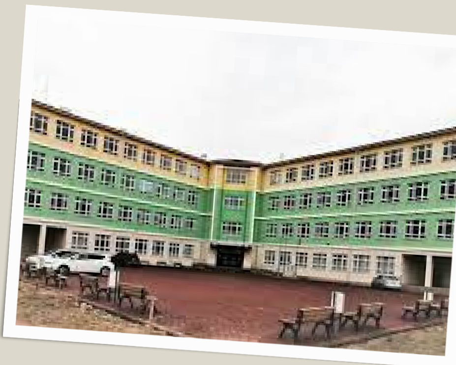
Beypazarı Fatih Mesleki ve Teknik Anadolu Lisesi