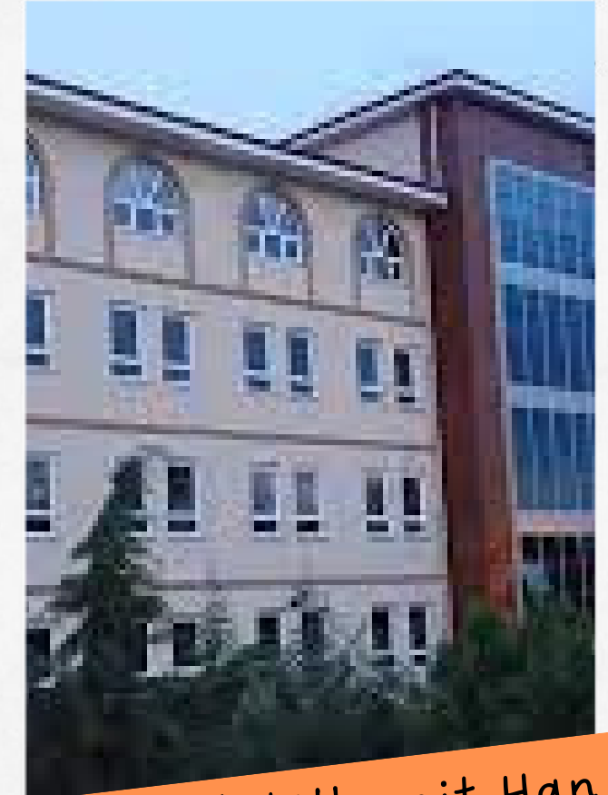
Ayaş Abdülhamit Han Anadolu İmam Hatip Lisesi

Yerel Yerleştirme ile öğrenci almaktadır.