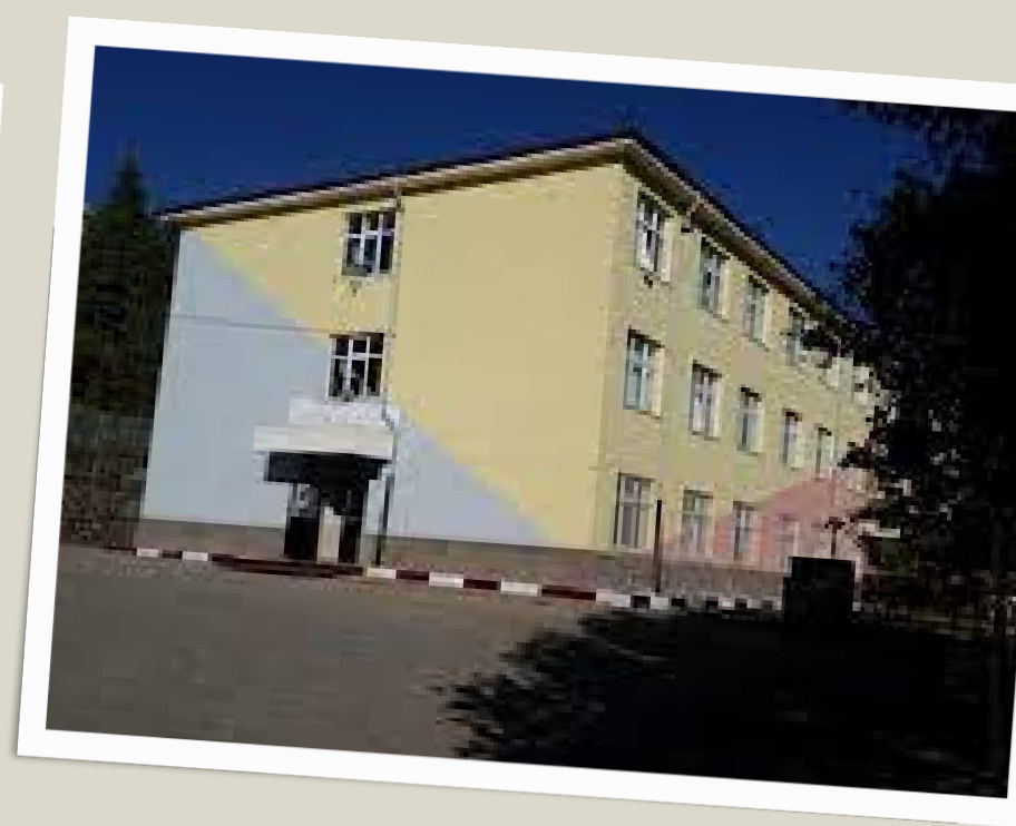
Ayaş Naime Ali Karataş Mesleki ve Teknik Anadolu Lisesi_