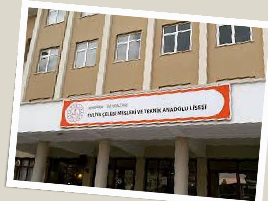
Beypazarı Evliya Çelebi Mesleki ve Teknik Anadolu Lisesi