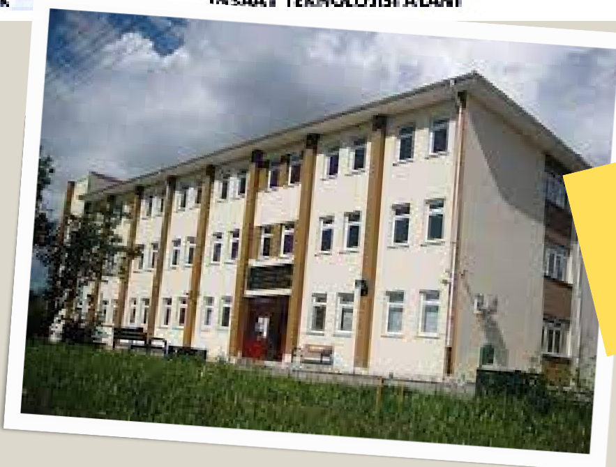
GÜDÜL SAFİYE AKDEDE ÇOK PROGRAMLI ANADOLU LİSESİ

Bu bölümde yer alan okullar Yerel Yerleştirmeye öğrenci almaktadır.