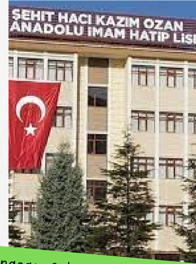
Beypazarı Şehit Hacı Kazım Ozan Kız Anadolu İmam Hatip Lisesi

Yerel Yerleştirme ile öğrenci almaktadır.