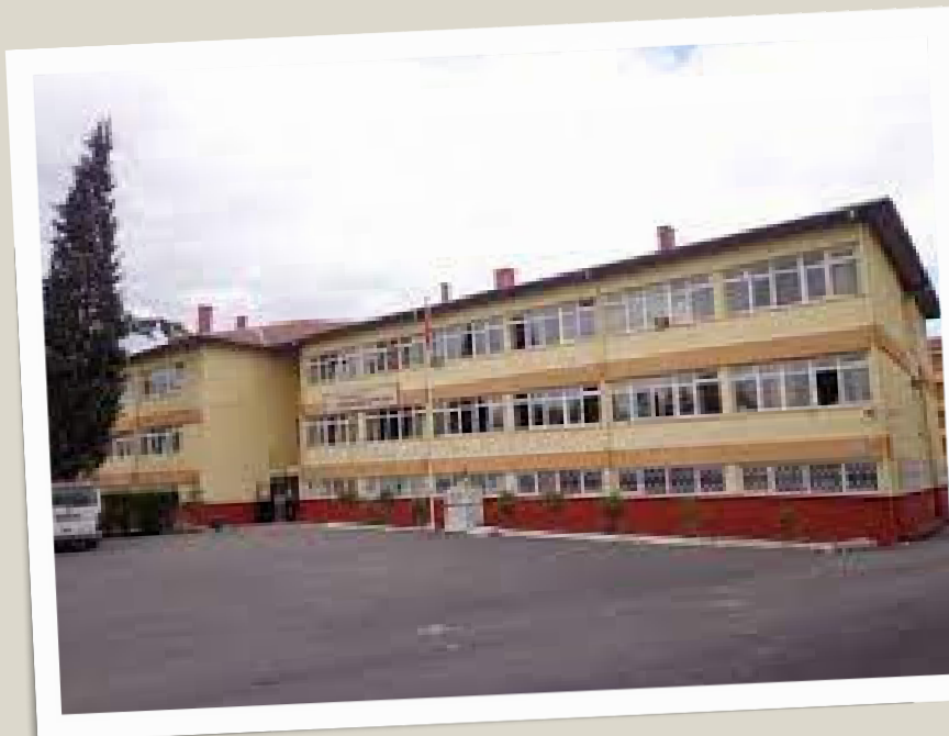
Beypazarı Şehit Sefa Tiftik Erkek Anadolu İmam Hatip Lisesi

Yerel Yerleştirme ile öğrenci almaktadır.