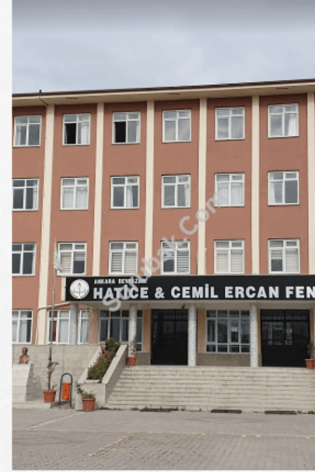
Beypazarı Hatice Cemil Ercan Fen Lisesi

2021 taban puan: 353.0039 2021 yüzdellik dilim: %13.57 2021 kontenjan: 180