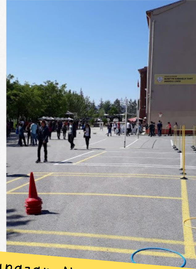
Beypazarı Nurettin Karaoğuz Vakfı Anadolu Lisesi

Yerel Yerleştirme ile öğrenci almaktadır.