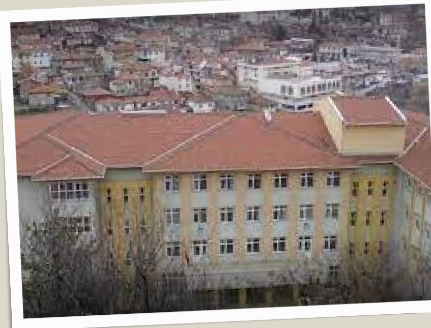
Ayaş Şehit Rıdvan Süer Anadolu Lisesi

Yerel Yerleştirme ile öğrenci almaktadır.